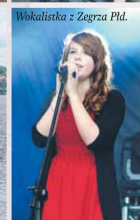
Wokalistka z Zegrza Płd.