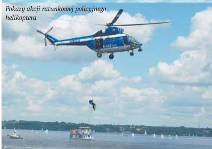
Pokazy akcji ratunkowej policyjnego helikoptera