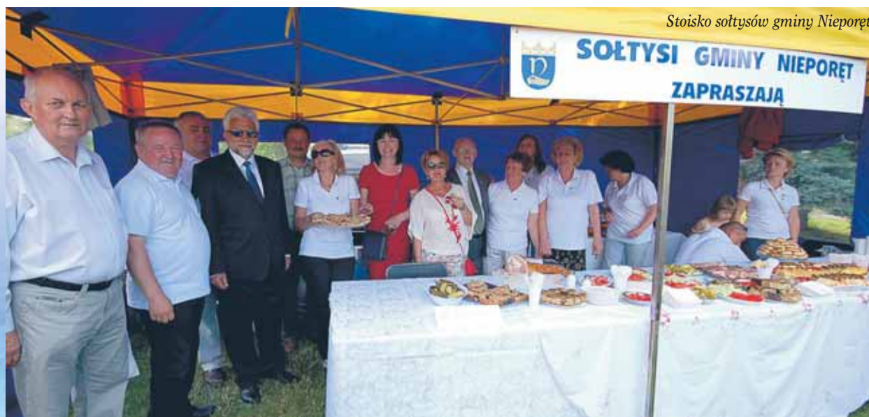
Stoisko soltysów gminy Nieporęt