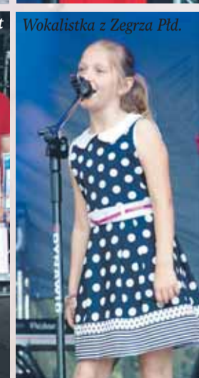
Wokalistka z Zegrza Płd.