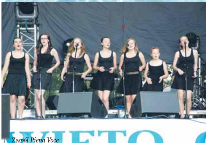
Zespół Piena Voce