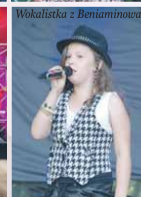
Wokalistka z Benjaminowa