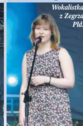
Wokalistka z Zegrza Płd.