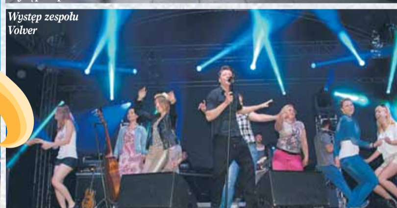
Występ zespołu Volver