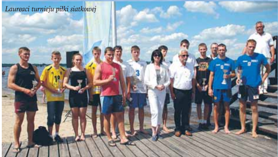
Laureaci turnieju piłki siatkowej