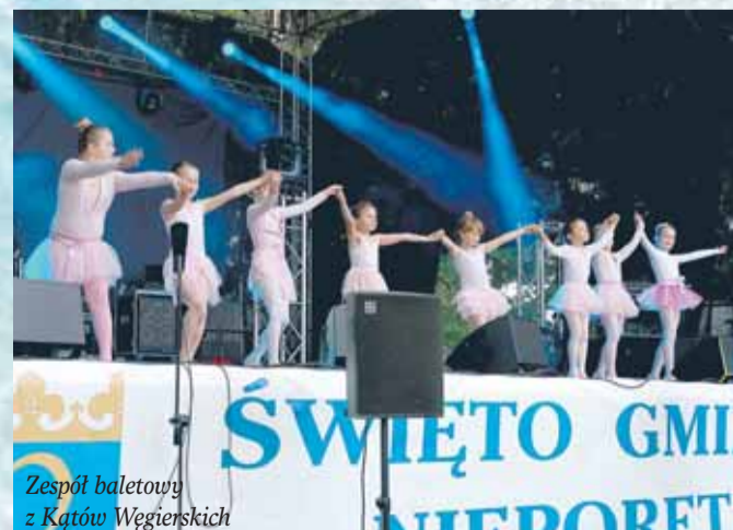
Zespół baletowy z Kątów Węgierskich