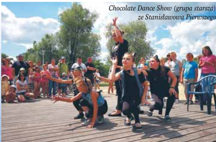
Chocolate Dance Show (grupa starsza) ze Stanisławowa Pierwszego