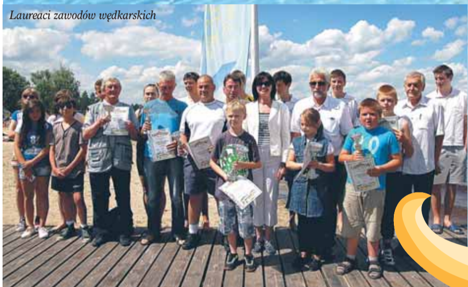
Laureaci zawodów wędkarskich