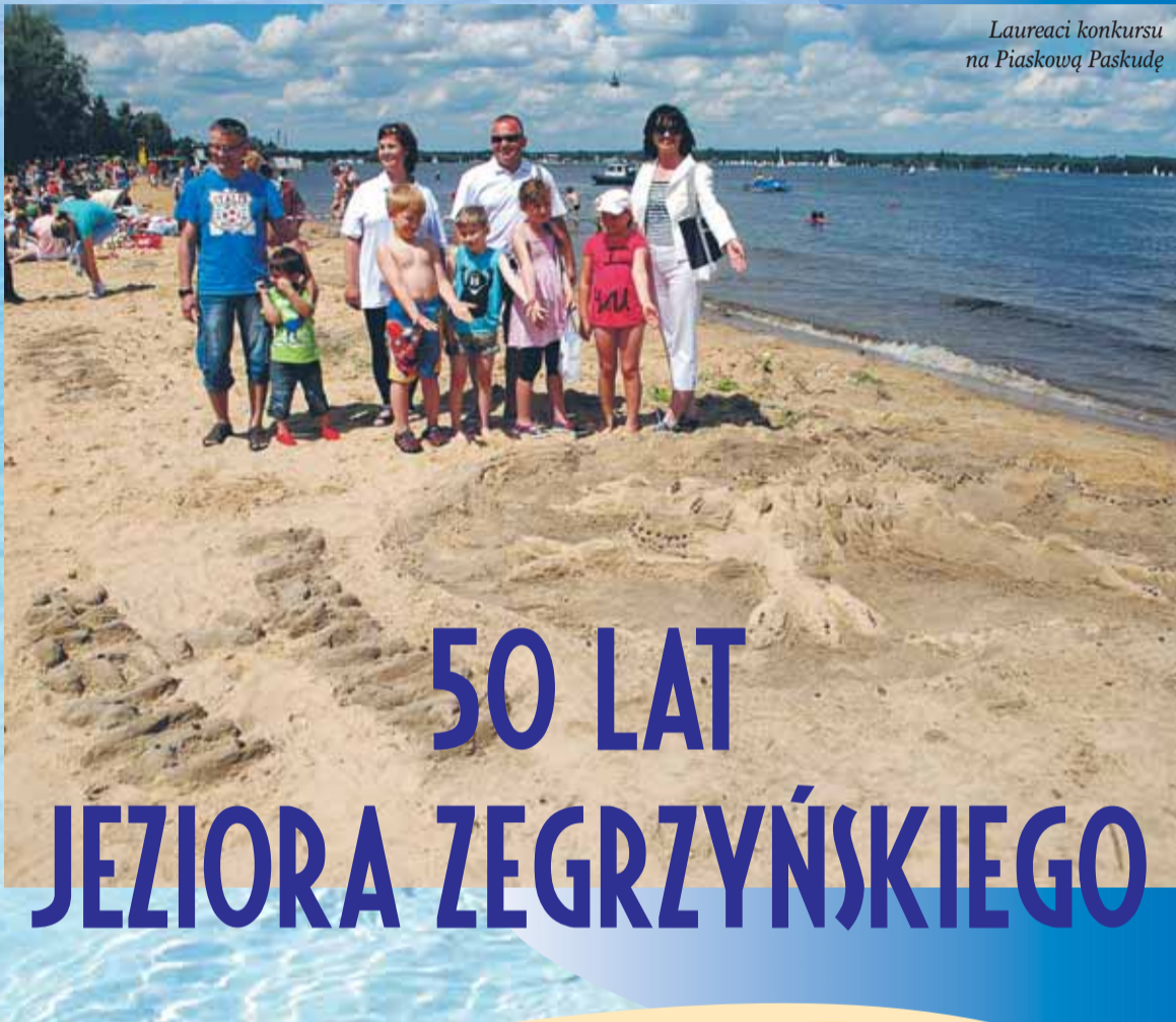
Laureaci konkursu na Piaskową Paskudę