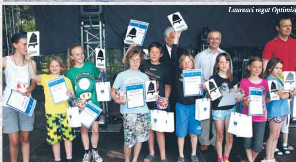
Laureaci regat Optimist