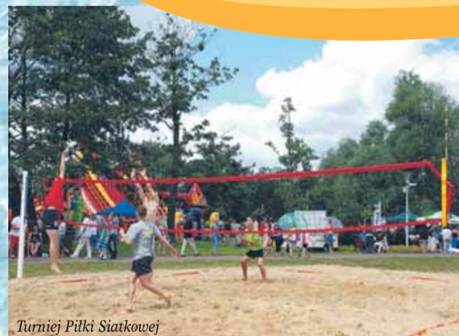
Turniej Piłki Siatkowej