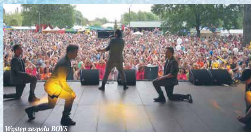
Występ zespołu BOYS