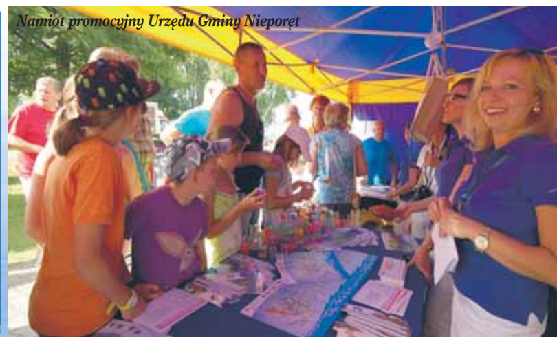
Namiot promocyjny Urzędu Gminy Nieporęt