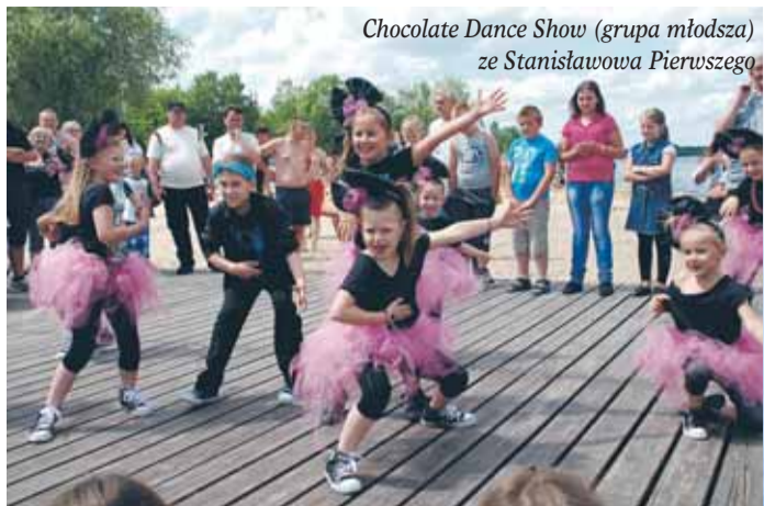
Chocolate Dance Show (grupa młodsza) ze Stanisławowa Pierwszego