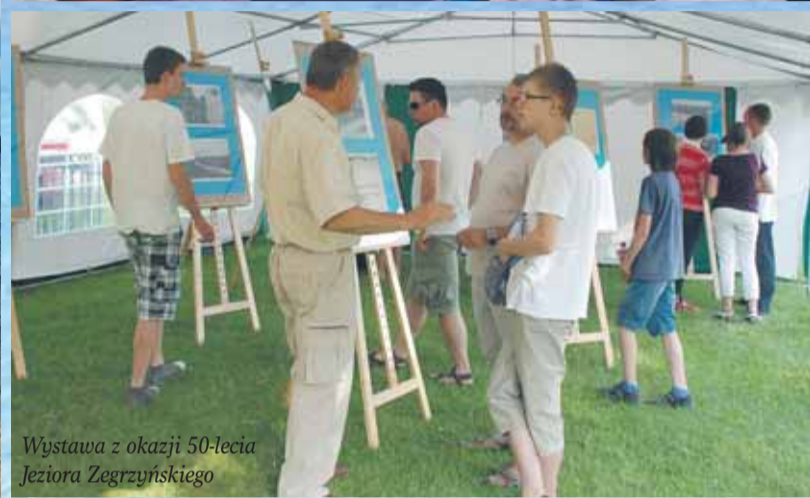
Wystawa z okazji 50-lecia Jeziora Zegrzyńskiego