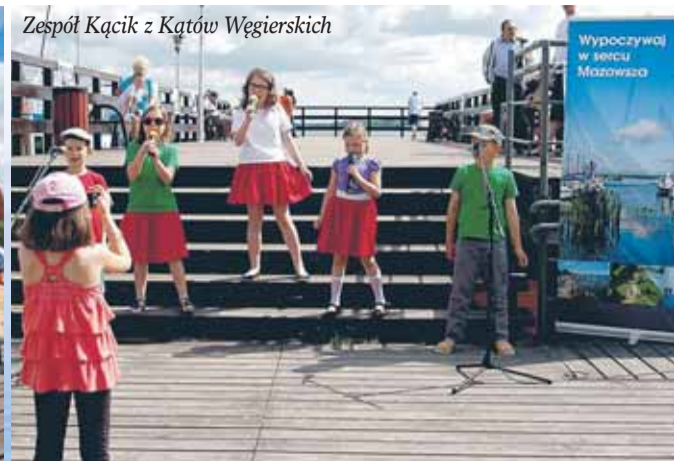
Zespół Kącik z Kątów Węgierskich