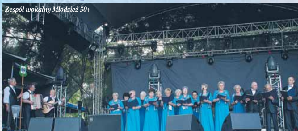
Zespół wokalny Młodzież 50+