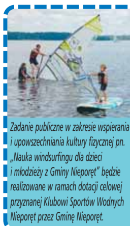
Zadanie publiczne w zakresie wspierania i upowszechniania kultury fizycznej pn. „Nauka windsurfingu dla dzieci i młodzieży z Gminy Nieporęt” będzie realizowane w ramach dotacji celowej przyznanej Klubowi Sportów Wodnych Nieporęt przez Gminę Nieporęt.